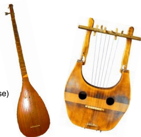
Tambûr Perse & Phorminx Grec